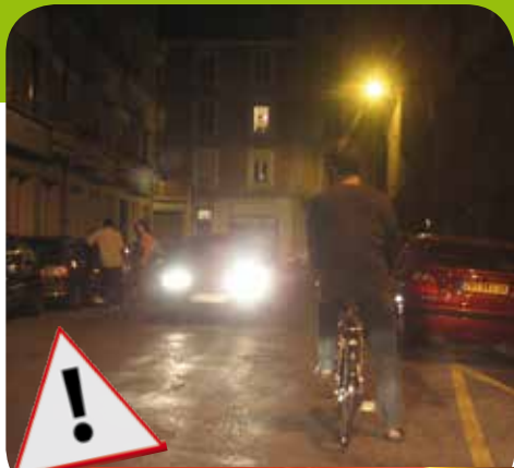
Cycliste non équipé