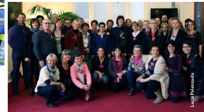
Assemblée nationale, Paris, 8 mars 2016 : une invitation de Bernadette Laclais (au centre), députée savoyarde, à l'occasion de la Journée de la femme. La qualité des échanges furent à la hauteur des enjeux. Joie de bénéficier d'une écoute et d'une attention sincères.