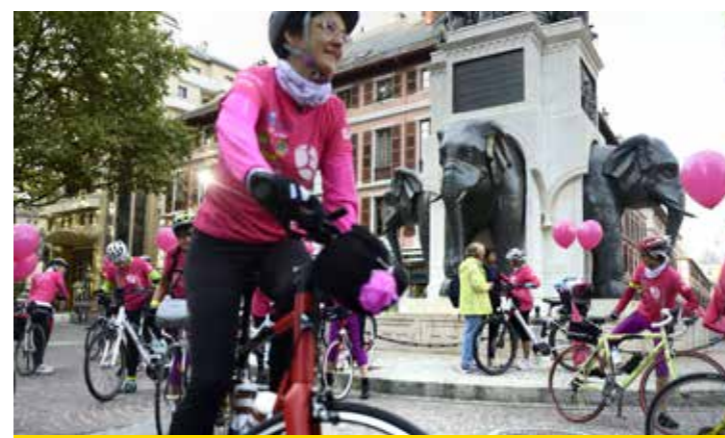
Chambéry - Saintes-Maries-de-la-Mer : c'était super !