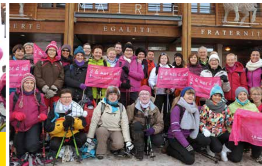
Super week-end à Valloire, janvier 2016 : rando-raquettes, spectacle sur les sculptures de neige et film : À la mer à vélo, version longue ! Un week-end magnifique sous le soleil. Un accueil chaleureux de la mairie de Valloire !