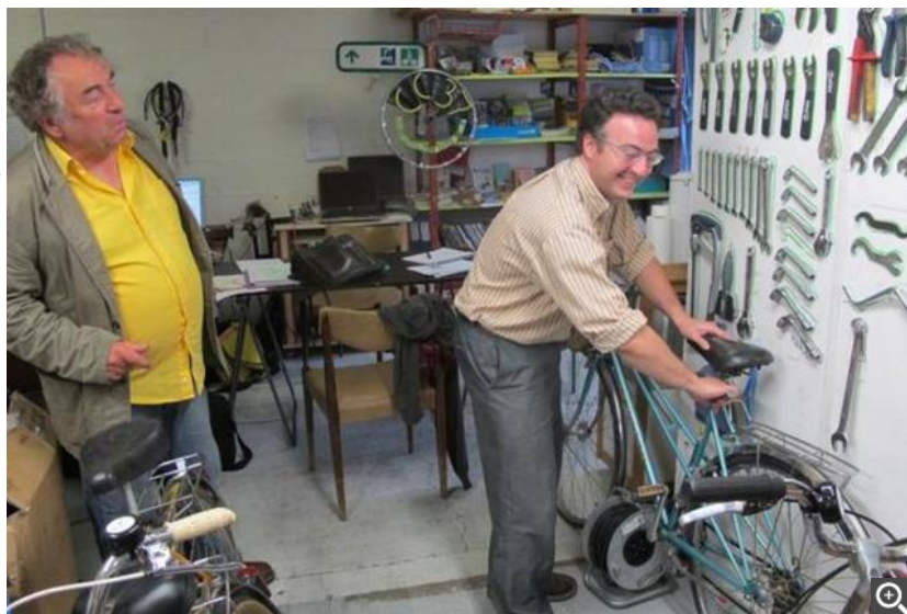
A Tours, le Vélopôle permet aux adhérents de réparer leurs vélos et de récupérer des pièces d'occasion.

Dans son local tout près de la tour Étoile, les cyclistes adhérents de l'association viennent réparer leurs vélos. Grâce à l'atelier recyclage, ils peuvent récupérer des pièces comme des dérailleurs pour les adapter sur leurs deux-roues. Réparé, le vélo pourra servir pour participer aux balades urbaines organisées chaque mois par le collectif.