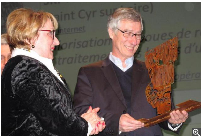
SKF a reçu le prix Grandes Entreprises pour sa valorisation des boues de rectification.

certaines actions poursuivies par le syndicat tout au long de l'année. Touraine Propre a ainsi récompensé plusieurs initiatives visant à lutter contre le gaspillage alimentaire. Certaines sont modestes, d'autres conséquentes. Ainsi la valorisation des boues de rectification réalisée par SKF est le fruit de cinq années de travail. Le projet a permis de récupérer 1.200 tonnes de boues comportant 90 % d'acier et de l'huile qui finissaient avant à la décharge et d'économiser 55.000 €. Comme quoi, nos poubelles peuvent contenir des trésors.