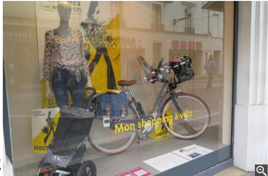
A découvrir dans les vitrines du Printemps.