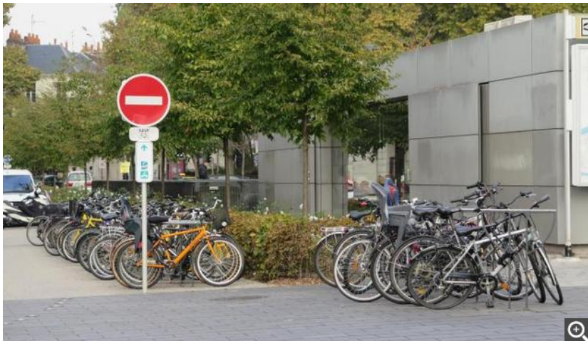
En plus d'une maison, un parking est également à l'étude.

partenaires financiers qui pourraient participer : agglomération, Ville de Tours, mais aussi Département, Région voire Europe.