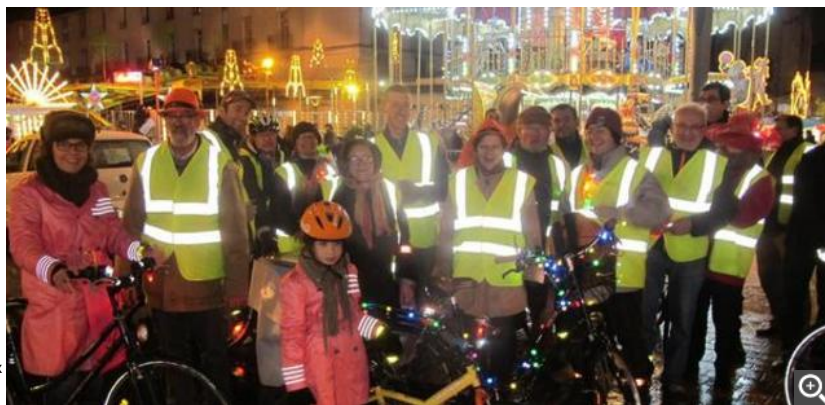
La parade lumineuse est partie de la place Anatole-France.

Déjà quatre sensibilisations avaient été faites auparavant : à la gare, sur le pont de fil et au Vinci.