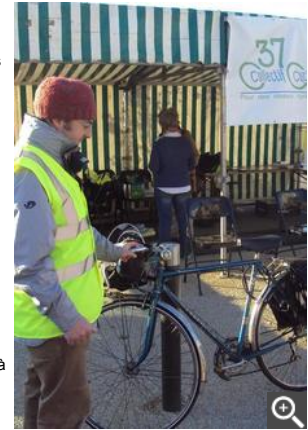
Tout est passé en revue dans un souci de sécurité et de pédagogie.

> Sainte-Cécile. La musique municipale fêtera sa sainte patronne dimanche 30 novembre. A 10 h 30 aura lieu la messe en musique ; à 12 h 30, déjeuner dansant dans la salle Maria-Callas. La participation pour le repas dansant est de 34 € par personne. Inscriptions avant le 22 novembre chez G. Duverger au 02.47.44.57.73.