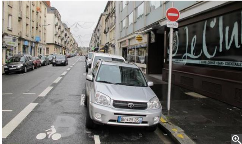
Double sens cycliste rue Marceau : un bon exemple, même si l'idéal serait évidemment une voie séparée de la circulation automobile.

> L'évolution. « On va dans le bon sens. Il faut savoir accepter de ne pas avoir tout tout de suite. Mais globalement, ça accélère. »