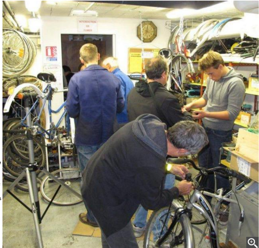
Une véritable caverne d'Ali Baba pour fans de la petite reine.