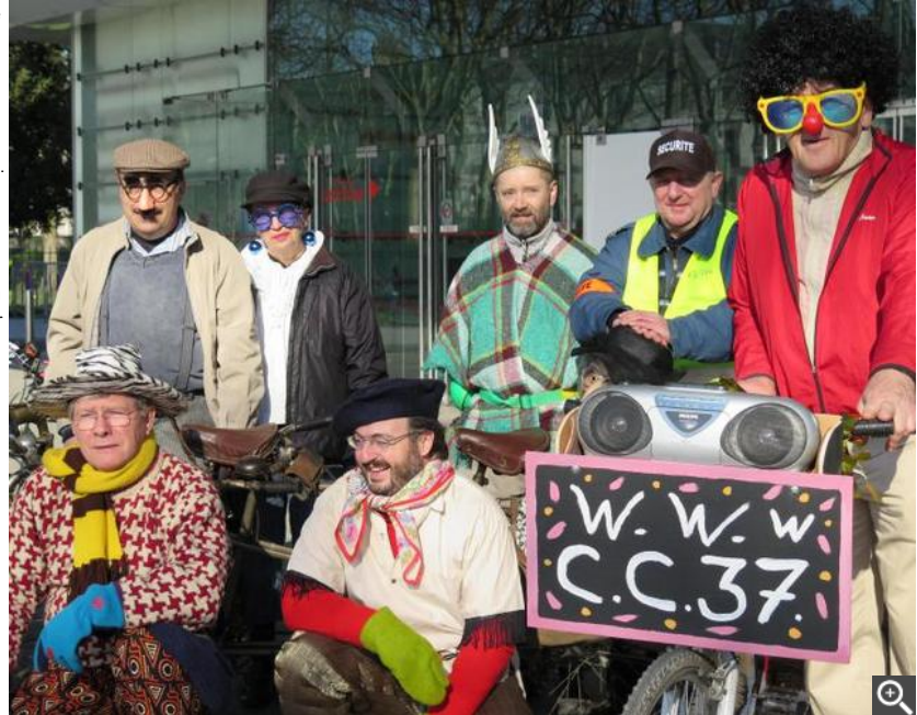
Et c'est parti pour une dizaine de kilomètres en ville.

Le lendemain, une petite vingtaine de membres se sont retrouvés devant le centre des congrès du Vinci pour le Carnavelo. Une première qui a peu mobilisé, malgré un temps magnifique. La prochaine sortie se déroulera dimanche 12 avril sur le thème des arbres remarquables à Tours et Saint-Cyr-sur-Loire. Rendez-vous à 15 h, toujours devant le Vinci.